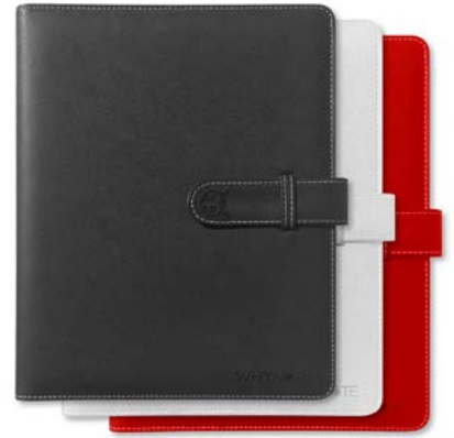
Housses de rangement A5