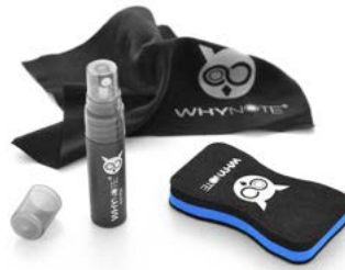
Kit de nettoyage (à remplir avec de l'eau)