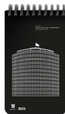
Exemples de couvertures personnalisées